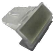
Conjunto separación de Billetes (Cassette)