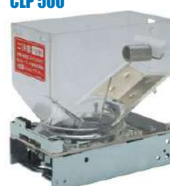
Hopper Asahi Seiko SK-595S