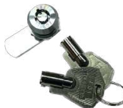
Llave de Seguridad Cassette Fujitsu