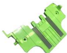
Placa de Presión Fujitsu