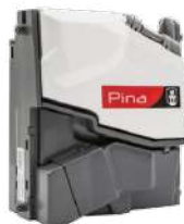
Validador de Monedas Azcoyen X6-D4S CCT