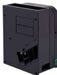
Hopper Universal Money Controls MK4