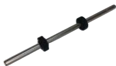
Eje Alimentación 4 Puloon LCDM 2000