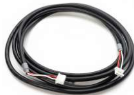
Cable de RS232 Fujitsu F56 (Comp/Skidata)

ventas@grupopotenza.cl www.grupopotenza.cl