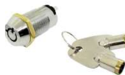
Llave de Seguridad Cash Box MEI