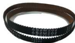
Timing Belt S2M202 Fujitsu F56