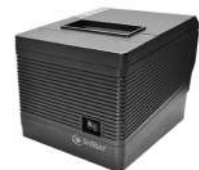
Impresora Termica 3nStar 80mm RPT008