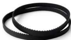
Correa MXL Chasis Cassette Drive BBC