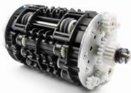
Path Switch Bill to Bill