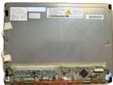
Pantalla LCD 10.4" (Compatible Con Skidata) AA104VC09