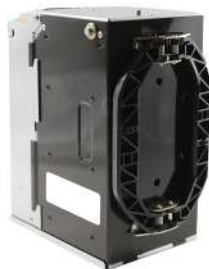
Cash Box 600 note CashCode