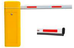
Pluma octogonal de Aluminio COMA