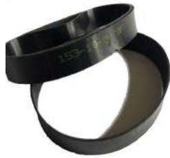
Flat Belt 153 Fujitsu F56