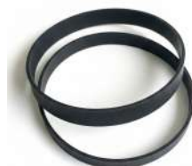
Drive Flat Belt Shutter BBD-0310