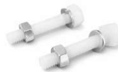
Pernos Fusibles Plastico M8x50mm