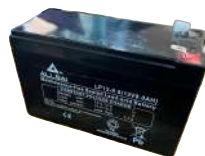
BATERIA ALLSAI 12V 18AH Serie LP