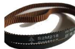
Timing Belt S2M218 Fujitsu F56