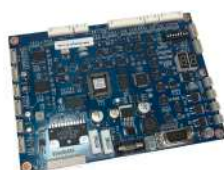
Main Board Puloon LCDM 2000