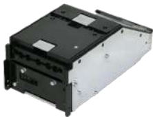
Cabezal CashCode MFVL 9013