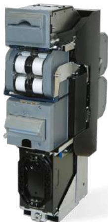
Reciclador de Billetes Bill to Bill