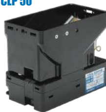
Hopper Asahi Seiko SA-595LC