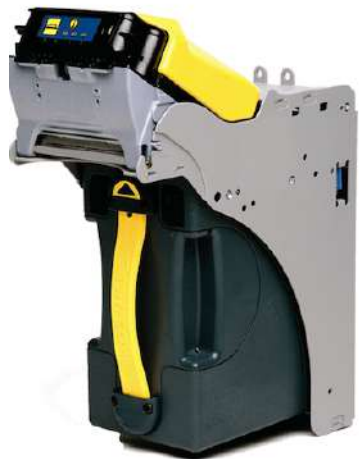
Validador de Billetes SC Advance 83XX