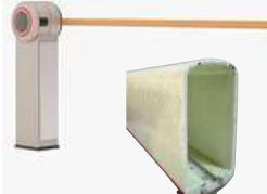
Pluma para Barrera FV Rect. Blanca