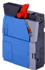
Validador de Monedas NRI v² Eagle Cctalk