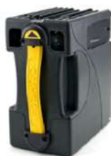
Cash Box 600 note SC Advance

ventas@grupopotenza.cl www.grupopotenza.cl