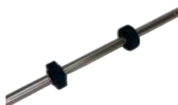
Eje Alimentación 5 Puloon LCDM 2000