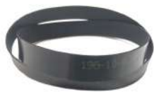
Flat Belt 196 Fujitsu F56