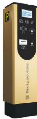
Dispensador de Ticket