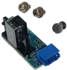
Sensor de Espesor Fujitsu F56