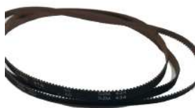
Timing Belt S2M434 Fujitsu F56