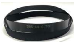
Flat Belt 266 Fujitsu F56