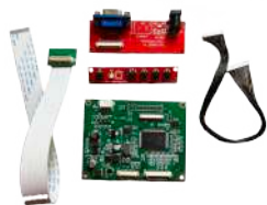
Placa VGA para Monitor LED