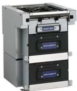
Dispensador Billetes Puloon LCDM 2000