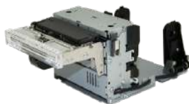
Impresora NPI Mod. NP-KV30DK 3"