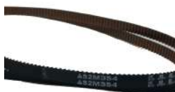
Timing Belt S2M354 Fujitsu F56