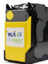
Modulo Reciclador SCR Advance MNE