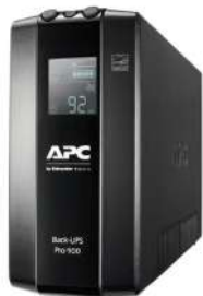
Back UPS Pro BR 900VA BR900MI APC