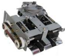
Retract Box Fujitsu F56