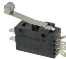
Microswitch ZF Cherry E20