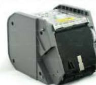
Casete Reciclador Bill to Bill