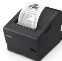
Impresora EPSON TM-T88VII RS232