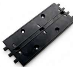
BBC Guide Assembly Chasis Bill to Bill