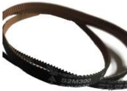
Timing Belt S2M300 Fujitsu F56