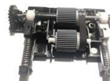
Kit Pick Roller Fujitsu