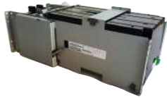
Unidad de Extensión 500 notes Fujitsu F56