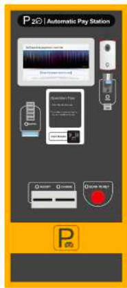
Maquina de Pago Automatico (APM)