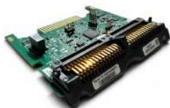
Placa Interfase MEI SCR / USB