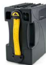
Cash Box 600 note SC Advance