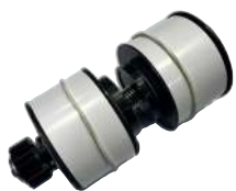
B2B Eje de Cinta Superior BBR-0110