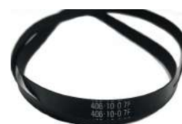
Flat Belt 406 Fujitsu F56