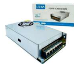
Fuente de Poder 12V. 20 Amp. IRM