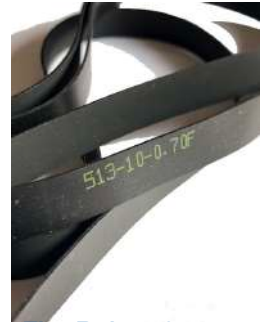
Flat Belt 513 Fujitsu F56