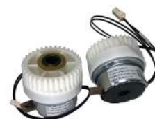
Solenoid Puloon LCDM 2000