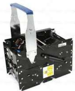
Chasis Bill to Bill