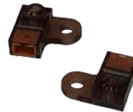
Sensor Detector Fujitsu F56