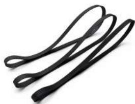
Correa MXL BBDR-0310 A6Z16M194060