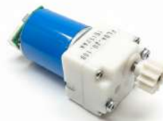
Motor Drive Assembly Chasis BBC_0110