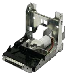
MFL Power Interface Drop Cassette B2B