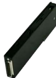
Power Interface Bill to Bill