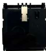
B2B Conjunto de guía (tapa BBR)