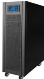
UPS ALLSAI ON LINE 20KVA Monofónica