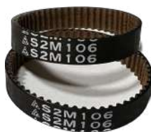
Correa Dentada S2M106 Fujitsu