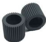
Par de Pick Roller Fujitsu