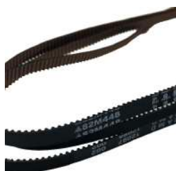
Timing Belt S2M448 Fujitsu F56