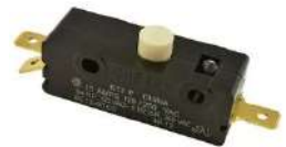
Microswitch ZF Cherry E13