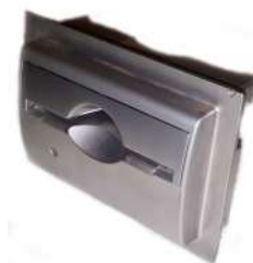
Boquilla Metálica Bezel Bill to Bill