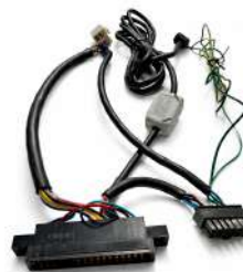
Cable USB para SCR Mei