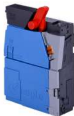
Validador de Monedas NRI v² Eagle BACTA