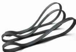
Correa 156MXL023 A6Z16M156060 BBD-0310