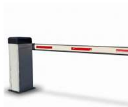
Pluma de Aluminio Rectangular 3 metros