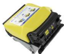
Cabezal MEI SCR 8328M Anti-Skew