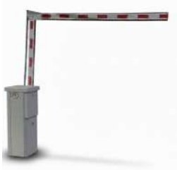
Pluma de Aluminio Articulada 3,3 metros