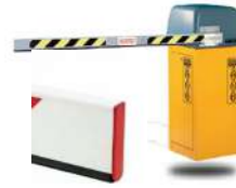
Pluma para Barrera Aluminio Rectangular