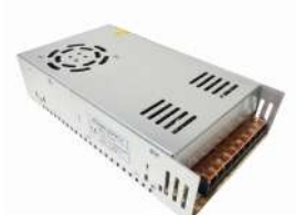
Fuente de Poder 24V 15A para F56