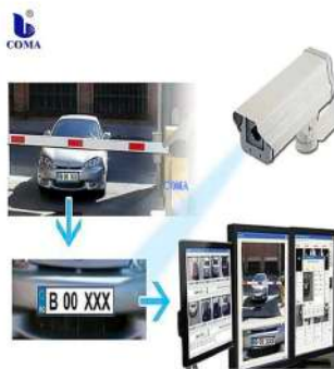
Sistema Automático De Gestión De Patentes