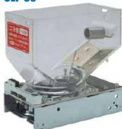
Hopper Asahi Seiko SK-595S