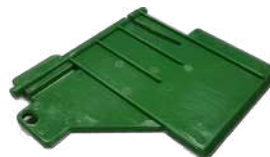
Placa de Presión Posterior Fujitsu