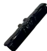
B2B Montaje de guía para BBR-0110