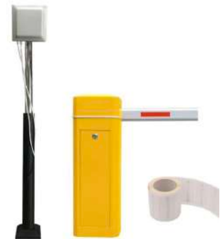
Sistema de Estacionamiento RFID