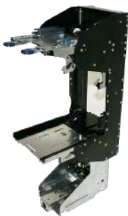
Housing Bill to Bill