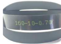
Flat Belt 160 Fujitsu F56