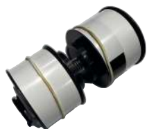
B2B Eje de Cinta Inferior BBR-0110