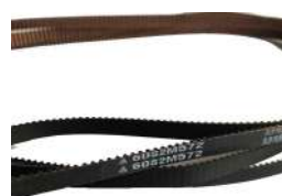
Timing Belt S2M572 Fujitsu F56