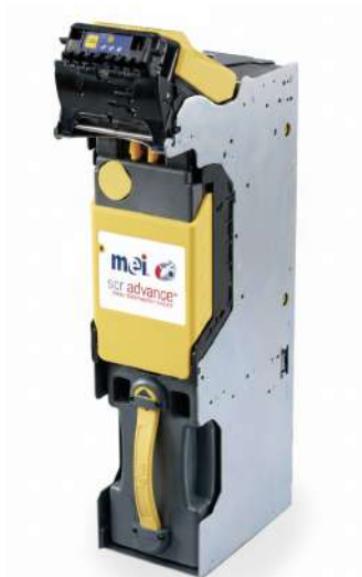
Reciclador de Billetes SCR Advance 8328M