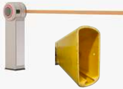
Pluma para Barrera FV Rect. Amarilla