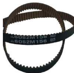
Timing Belt S2M156 Fujitsu F56