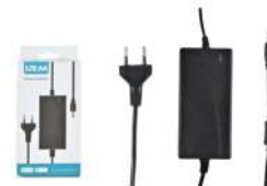
Transformador 12 v. 5 Amp. IRM