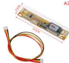
Placa Inversora Para Pantallas LCD