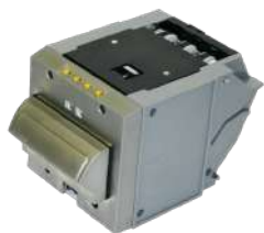
Casete Dispensador Bezel Metálico B2B