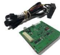
Tarjeta Controladora Hopper MK4