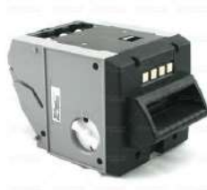
Casete Dispensador Bill to Bill