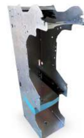
Chasis S SCR Reciclador MEI