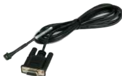
Cable de Comunicación Fujitsu F56