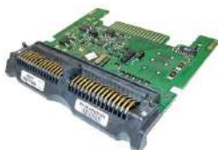
Placa Interfase MEI P/SC Advance 83XX