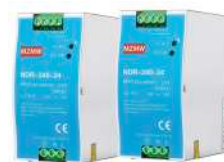
Fuente de Poder Riel DIN 24V. 10 Amp.