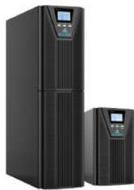
UPS ALLSAI W pro 3 kVA