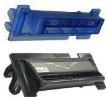
Boquilla MEI Serie Bezel