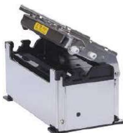
Cabezal Termico Impresora CAPM347