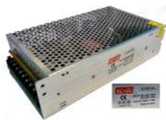
Fuente de Poder 24V. 15 Amp. Univ.