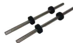
Eje Alimentación 6 Puloon LCDM 2000