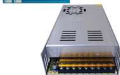
Fuente de Poder 12V. 50 Amp. IRM