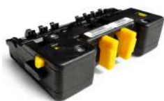
Cassette Assembly SCR mei