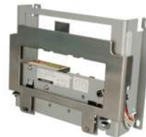
Shutter Fujitsu F56