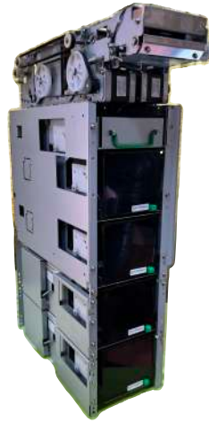
Dispensador 4 Denominaciones Fujitsu F56