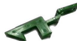
Pestillo de Bloqueo (Lock Latch)